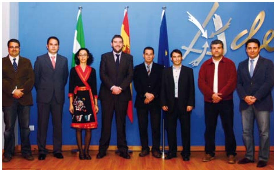
Nueva Junta de Gobierno de la Asociación Andaluza de Ingenieros Técnicos de Telecomunicación (AAITT).

Entre los objetivos que se ha propuesto la nueva Junta de ITACA destacan el impulso de convenios globales con el mundo académico, como el que ya firmó la Asociación castellano manchega con la ULM, gracias al cual se prioriza la oferta y orientación de oportunidades a los profesionales egresados de esta Universidad. Asimismo, ITACA ha asumido el reto formativo mediante iniciativas, tales como la impartición del Máster en Edificación y Hogar Digital, que va por la tercera promoción; o la organización